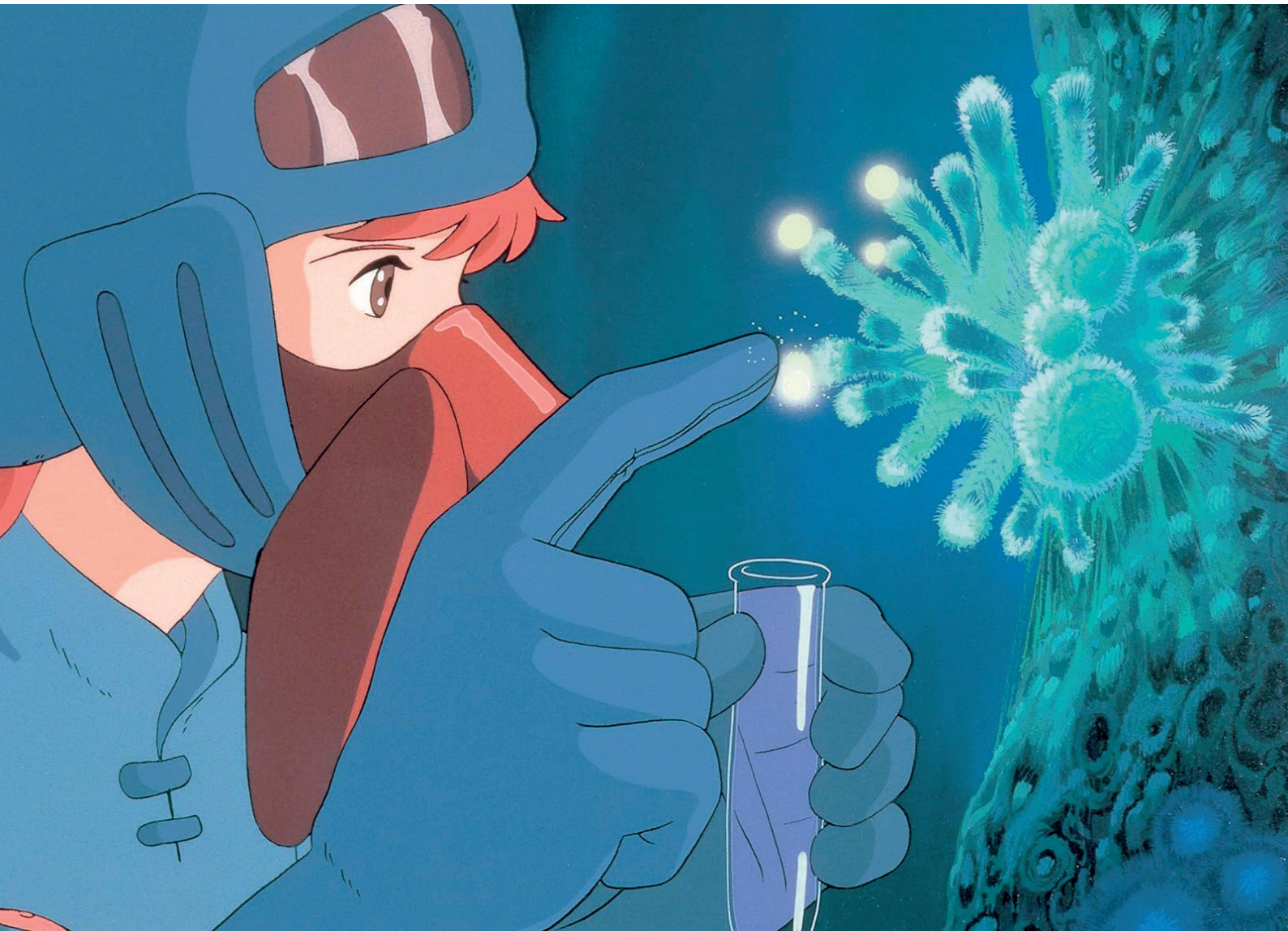
Nausicaä de la vallée du vent de Hayao Miyazaki